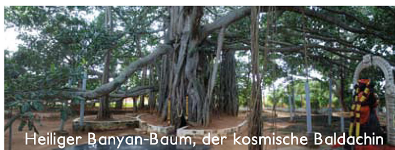
Heiliger Banyan-Baum, der kosmische Baldachin

100% der Teilnehmer und Teilnehmerinnen des letzten Inner Awakening berichten über eine enorme Bewusstseinsveränderung. Umfragen, die nach dem Inner Awakening bei den Teilnehmern und Teilnehmerinnen durchgeführt wurden, weisen drastische Verbesserungen in den Bereichen Arbeitsleistung, Heilung von Beziehungsthematiken und Beseitigung von Stimmungsschwankungen auf. Die wohl bedeutendste Transformation ist die Fähigkeit, auf alle Lebensumstände mit Ruhe, Spaß und Klarheit zu reagieren.